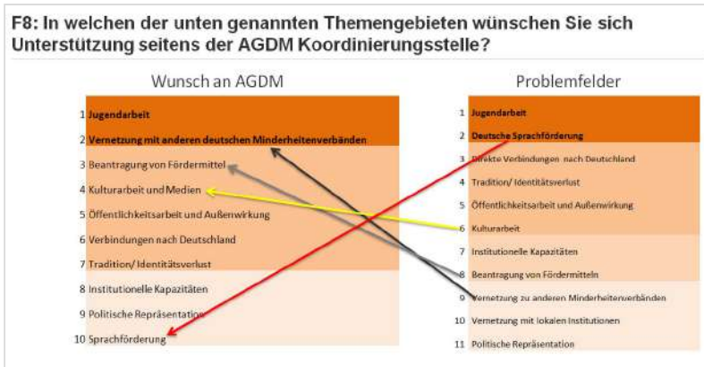
Grafik 2: Gegenüberstellung der identifizierten Herausforderungen der Verbände und Wünsche an das AGDM Koordinationsbüro