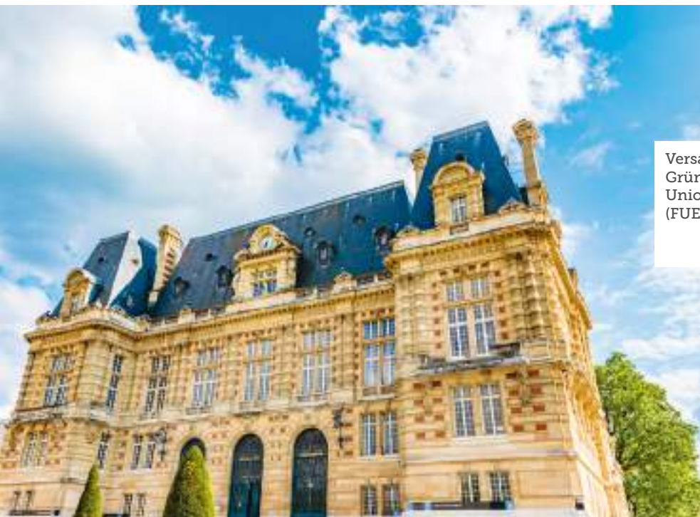
Versailles Hôtel de Ville - Gründungsort der Föderalistischen Union Europäischer Volksgruppen (FUEV)