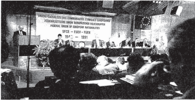
MIT 250 TEILNEHMERN stellte der 18. Nationalitätenkongress in Budapest die bisher größte Veranstaltung der Föderalistischen Union Europäischer Volksgruppen (FUEV) dar