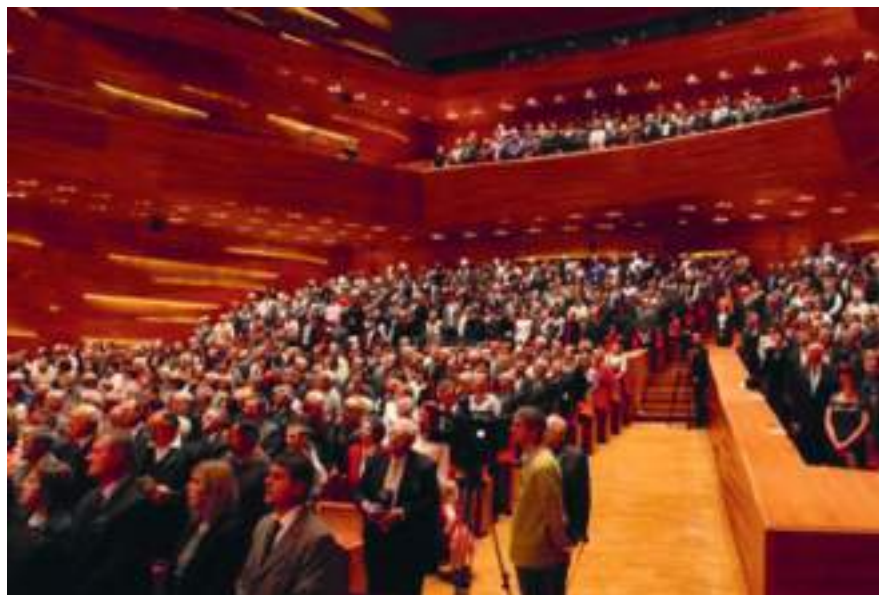
FUEN Kongress in Budapest 1991

Die Nationalitätenkonflikte im mitteleuropäischen sowie ost- und südosteuropäischen Raum sind seit Beginn unseres Jahrhunderts ungelöst und nach dem Systemwechsel im ehemaligen Osten wieder transparent geworden.