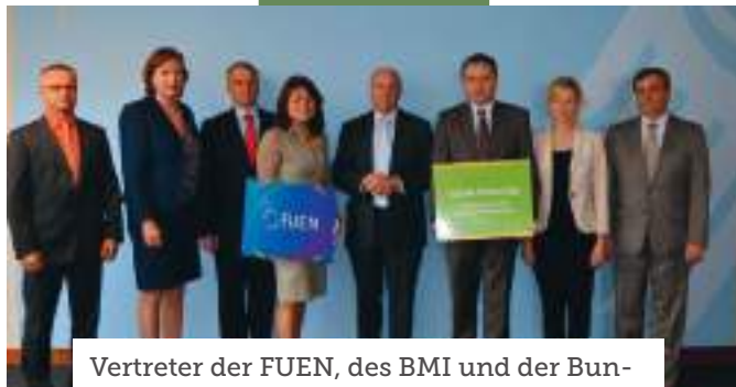
Vertreter der FUEN, des BMI und der Bundesbeauftragte Hartmut Koschyk in Berlin

wie ihre neue AGDM Koordinierungsstelle mit Sitz in Berlin zum ersten Mal beim Tag der offenen Tür im neuen Gebäude des Bundesministeriums des Innern in Berlin präsent. Dieses Jahr standen auch die in der FUEV vertretenen deutschen Minderheiten im Vordergrund. Diese Präsenz ermöglichte es, die Aufmerksamkeit des Berliner Publikums auf die AGDM, die deutschen Minderheiten in Mittel- und Osteuropa sowie auf die GUS-Staaten zu lenken und zu stärken